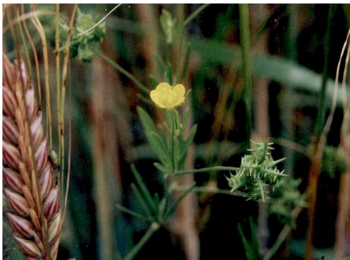
Die großen, stacheligen Samen des Acker-Hahnenfußes ( Ranunculus arvensis ) können durch die Saatgutreinigung leicht entfernt werden. Die Art ist daher sehr selten geworden.