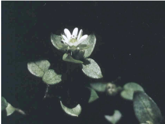
Die dichten Polster der Vogelmiere ( Stellaria media ) bleiben meist auch im Winter grün. Die Pflanze war daher früher als vitaminreiches Wildgemüse beliebt.