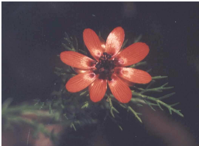
Das Sommer - Adonisröschen ( Adonis aestivalis ), früher ein weitverbreitetes 'Unkraut', ist heute vom Aussterben bedroht.

Die Heidelandschaft im Münchner Norden ist das Ergebnis jahrtausendelanger Bewirtschaftung durch den Menschen. Schon in der Jungsteinzeit, also vor etwa 6000 Jahren, begannen Menschen die lichten Wälder zu roden. Durch fortgesetzte Beweidung und Streunutzung der Wälder entstand im Laufe der Jahrtausende eine durch äußerst artenreiche Magerrasen und lichte, parkartige Wälder gekennzeichnete Heidelandschaft.