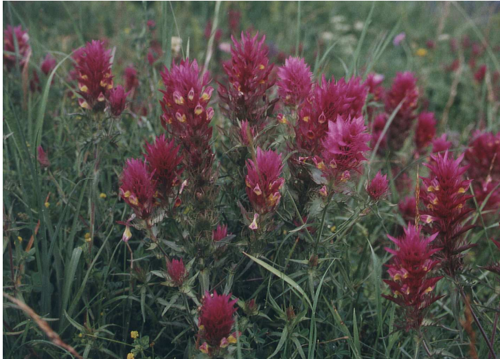
Der Acker - Wachtelweizen ( Melampyrum arvense ) war früher auf Äckern um Garching und Eching zu finden. Die ehemaligen Standorte werden heute als Maisäcker genutzt, derzeit sind keine Vorkommen der Art im Naturraum mehr bekannt. Ob es gelingt, Spenderpflanzen für das Feldflorencereservat zu finden, ist fraglich.

Ob es gelingt, alle früher im Münchner Norden heimischen Ackerwildkräuter im 'Feldflorencereservat Kastnergrube' wieder anzusiedeln, ist fraglich - von vielen Arten, wie dem Blauen Gauchheil, dem Gelben Günsel oder dem Acker-Wachtelweizen sind derzeit keine Vorkommen im Naturraum mehr bekannt. Hier müssen Glück, Zufall und (wie schon bisher) Hinweise von ortskundigen Pflanzenfreunden weiterhelfen. In jedem Fall aber kann die Fläche als Rückzugsgebiet für bedrohte Arten und als Spenderbiotop für eventuelle weitere Feldflorencereservate oder Ackerrandstreifen einen wertvollen Beitrag zur Erhaltung der Artenvielfalt in unserer Kulturlandschaft leisten. Und sicher nicht zuletzt soll es Spaziergängern und Erholungsuchenden im Naturschutzgebiet "Mallertshofer Holz mit Heiden" einen Eindruck davon vermitteln, wie farbenfroh und lebendig die Ackerflächen unserer Umgebung noch vor wenigen Jahrzehnten ausgesehen haben.