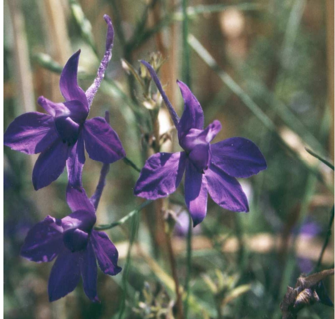
Der früher weitverbreitete Acker-Rittersporn ( Consolida regalis ) ist heute noch vereinzelt bei Pulling und Neufahrn zu finden. Sein Überleben im Naturraum soll durch die Ansiedlung im Feldflorenereservat gesichert werden.

Die früher landschaftstypische "Adonisröschengesellschaft" ist heute in der Münchner Schotterebene fast ausgestorben. Einige anpassungsfähige Arten, wie Hellerkraut, Nacht-Lichtnelke oder Hundspetersilie, sind zwar noch relativ häufig in Feldrainen und Brachäckern zu finden, Acker-Adonisröschen, Rittersporn, Tännelkraut, Saat-Leindotter und viele andere Arten sind jedoch bis auf kleine Reliktbestände verschwunden.