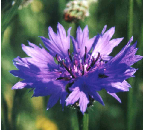
Die Kornblume ( Gentiana cyanus ) - die wohl bekannteste Wildpflanze unserer Äcker - wurde im Herbst 2001 wieder im Feldflorenreservat ausgesät.

Durch die Erfindung des Kunstdüngers Ende des 19. Jahrhunderts wurde der Lebensraum der Ackerwildkräuter in der Schotterebene zunächst deutlich erweitert. Bisher nicht nutzbare Flächen wurden durch zusätzliche Düngung ackerfähig, große Teile der Heideflächen zu Äckern umgebrochen. Dieser Aufschwung währte jedoch nur kurze Zeit: mit der Intensivierung der Landwirtschaft in der Mitte des 20. Jahrhunderts setzte ein sehr rascher und tiefgreifender Wandel der Feldflora ein, der durch eine sehr starke Verarmung der Artenvielfalt gekennzeichnet ist. Die Gründe für dieses Artensterben sind vielfältig: